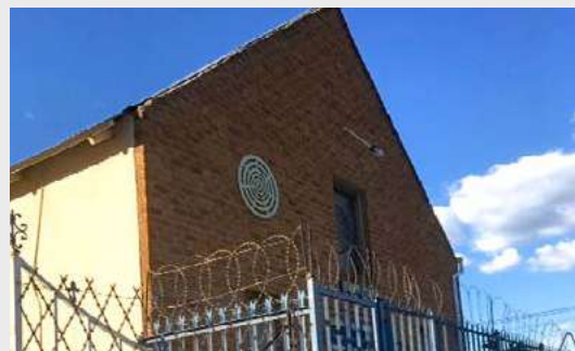
Johannesbourg, Afrique du Sud