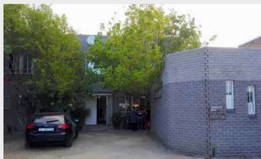
Ciudad del Cabo, Sudáfrica