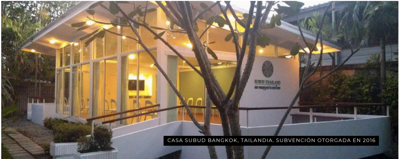
CASA SUBUD BANGKOK, TAILANDIA. SUBVENCIÓN OTORGADA EN 2016